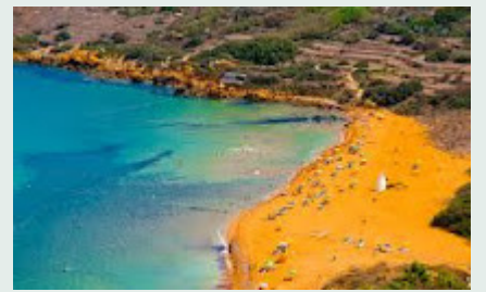
Baie de Ramla